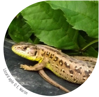
Lézard agile © E. Martin