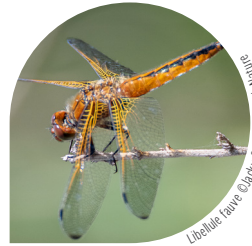
Libellule noire

L'Écopôle abrite un grand nombre d'espèces d'odonates (libellules et demoiselles) : venez apprendre à observer la Libellule déprimée, la Crotothémis écarlate ou encore l'Agrion. Tout un poème !